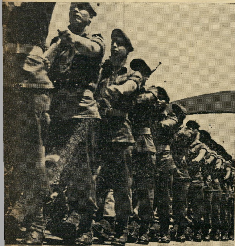
חן נשי: כל חיל שלח הפעם רק פלוגה אחת לייצוג. בנות חן, שבראשן צעדה קצינה ממוצא תימני, זכו מצד הקהל הרב לתשואות סוערות במיוחד, שלא היו רק מחמאה למינן.