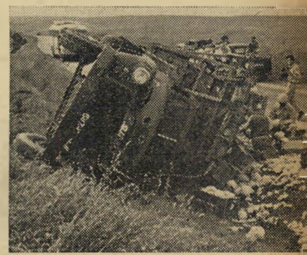
מוזון מושחת. משה זילברברג, נהג מברא"שבע, שנפגע בידו מיריות, איבד את השליטה בהגה והתהפך עם מכוניתו עמוסת התוצרת.