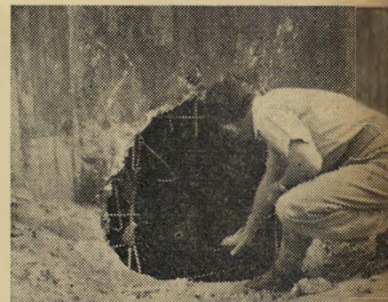
מכון המים של מגדל אשקלון שימש לא פעם מסרה לחבלות פידאיון. פיצוץ ליל שבת הבקיע אך חזר במגדל, לא גרם נזק רציני.