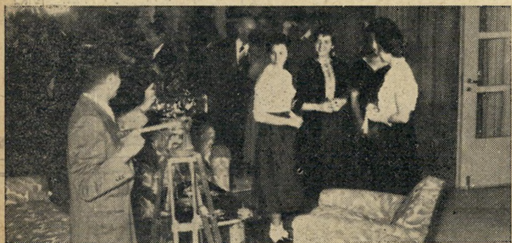
"להיך בבקשה!" צלם יומן כרמל מנציח כמה תמונות במסבת הקוקטייל בבית שגריר צרפת בישראל, זילבר. הצלם נלווה אל האורחת בשעת טיולה בארץ, הכין חומר לאחד מיומני כרמל, שנראהו בימים הקרובים על מסך בתי הקולנוע שלנו.