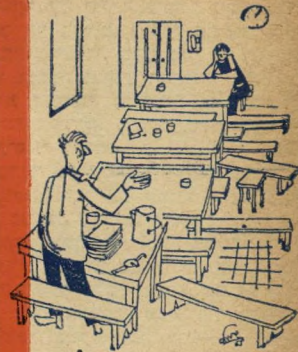
"יש למישהו שאלות?"