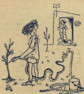
טעות לעולם חוזרת