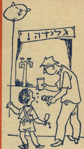
מן הכפר אל העיר