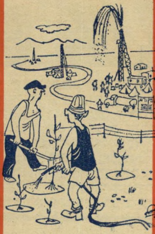
"איזה תרגון! שוב נפט במקום מים!"