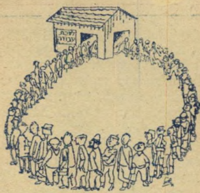
מעגל ללא קסמים