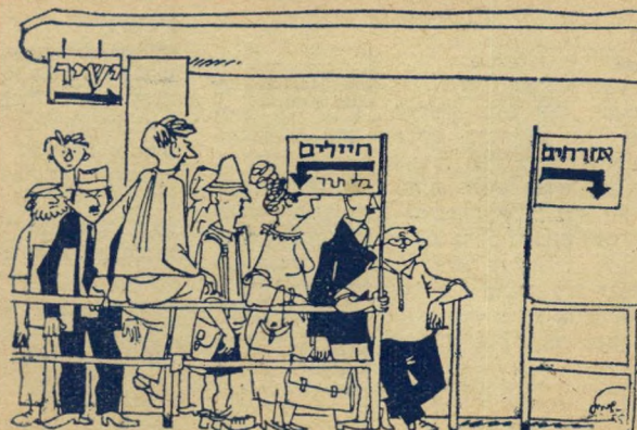
כל העם צבא