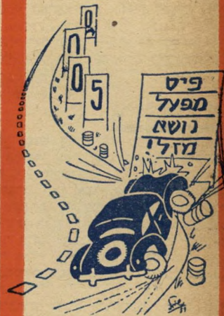
גם אתה לזכות עלול!