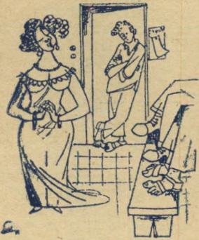
"אשיר לכם שירי עבודה!"

הקיבוץ הוא עולם שלם בפני עצמו. דרוש תורגמן טוב כדי לתרגם הווי זה לשפת העיר. אחד התורגמנים הטובים ביותר בארץ הוא שמואל כץ חבר משק השומר-הצעיר, שספרו "מעיר ומכפר" מכיל, בין השאר, קאריקטורות אלה.