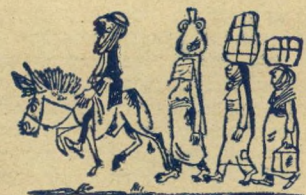
מיטי אברהם אבינו...