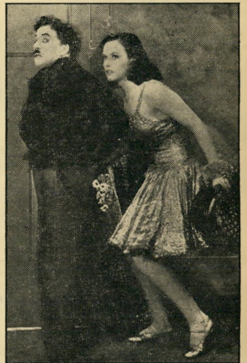
צ'אפלין ופולט גורארד ב"זמנים חדשים" האדם הקטן לא חש

● הוא נאלץ לראות סרטים מתורגמים בידי בורים ועמי ארצות המתרגמים את השיח מ־