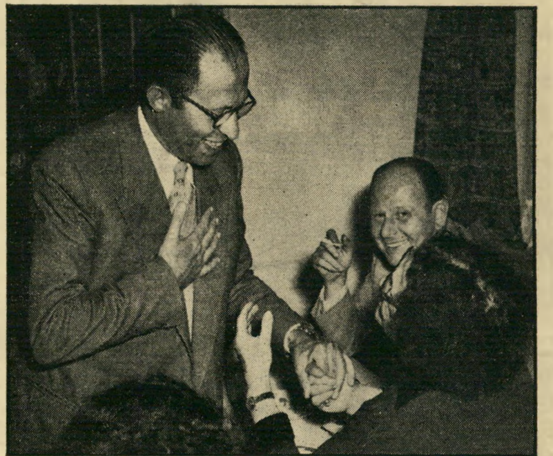
פודה בן-גוריון וח"כ בגין מיד אחרי השערוריה. "מצב המדינה כל כך טוב?"