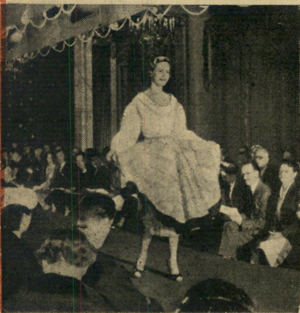
תצוגת אופנה מיוחדת תיערך באולמי כריסטיאן דיור לנציגות 21 הארצות. לכל נציגה ינתן ש"י שמלת נשף, עשויה לפי טעם ארצה.