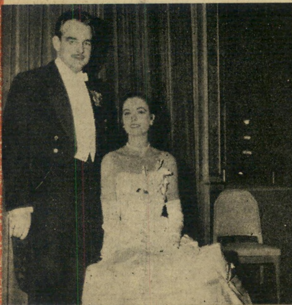
מסמור הסיוור: הזמנה אישית להשתתף בסעוד הנישואין של הנסיך רנייה ממונאקו וכוכבת הקולנוע גרייס קלי, במונטה'קרלו.