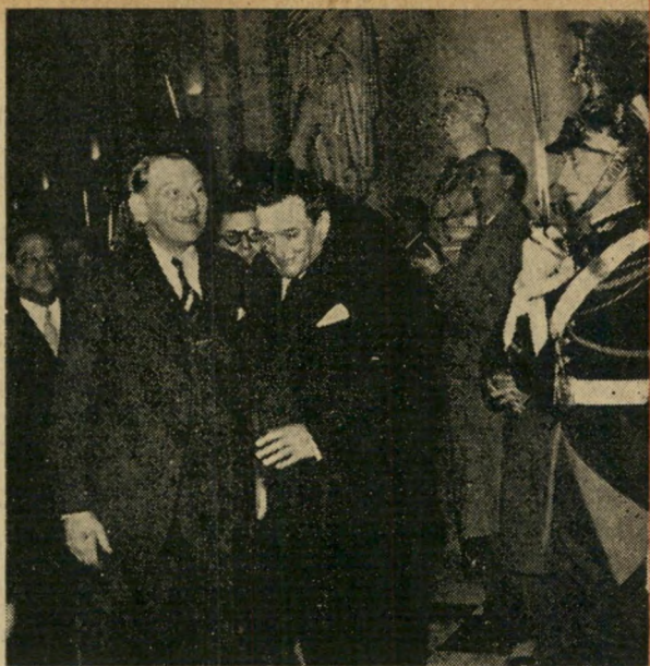
בארמון הנשיא. מאחר שתחרות זו היא מיפגש בינלאומי של נציגות העמים, התקבלנה המשתתפות רשמית על-ידי נשיא צרפת.