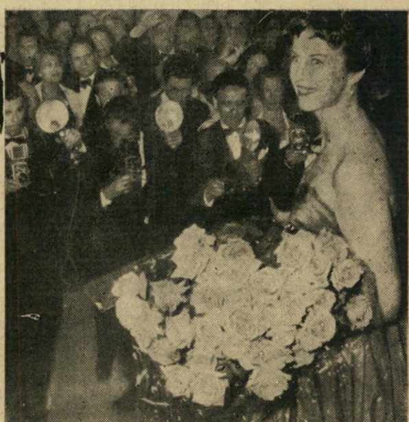
פסטיבל הסרטים. הנציגות יבקרו גם בקאן, ישתתפו בכמה ממאורעות פסטיבל הסרטים, מול מצלמות העתונות והטלביזיה.

במלון קומודור; מן המפוארים שבשאנז' אליזה. אחר הצהריים: מסעדת קוקטייל עם נציגי העתונות, הרדיו והטלביזיה. ארוחת ערב במסעדת הבסטיליה, חזרה למלון בשיירת מכוניות פתוחות לאורך הרחובות הראשיים.