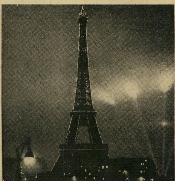
לינות פאריס. לרגלי מיגדל אייפל משתרעת פאריס, עיר האורות, על מאות מקומות הבידור והתרבות של העיר המפורסמת ביותר בעולם.