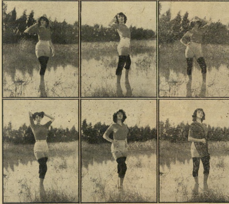
האורז המר בכפר אזור: שלבי הצמיחה

יהודה קטינא, תל'אביב הכל טוב ויפה, אבל אינני מכינה מדוע צריך בכיים תמונה כזאת משך שלוש שעות רצופות. רחל כץ, פתח-תקווה שלבי-היצילום, עד להשגת התמונה המבו" קשת — ראי סידרת התצלומים.