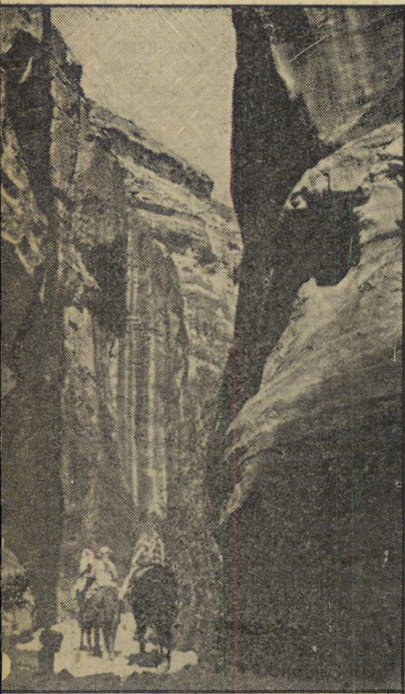
הסיק , מעבר בערבית — הוא מיצר מתפתל בין הוא צר ביותר ובמקומות מסוימים יכול לעבור בו רק

שום מקום בעולם אינו מעורר בלב הצעיר העברי געגועים כה עמוקים כפטרה, העיר החצובה בסלע האדום, הרומזת מרחוק לבאי הערבה אולם רק קומץ מבני הארץ זכה לראותה במו עיניו, וחמשה מטובי בני הקריבו את חייהם בנסיונם הנועז להגיע אליה. השנה הצליח דויד בויאר, חבר יהודי במערכת הירחון הגיאוגרפי הלאומי האמריקני להגיע לשם לאחר מסע הרפתקני ומלא ענין. זהו תיאורו המ