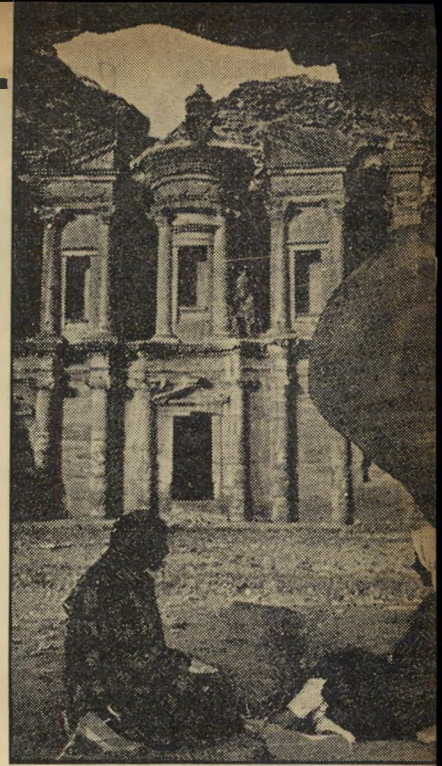
הדירי , הוא העתק של אוצר פרעה. שמו, שפירושו מנזר, ניתן לו למראה הצלבים שבו.