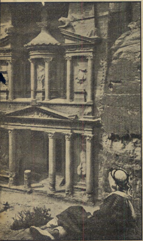
כזנת פיראון , אוצר פרעה, הוא הבניין היפה בפטרה. קיימת סברה כי בחזית הבניין קבורה ג' ארטס ה-4. שמלך במאה הראשונה לפני הספירה

לקת התיירות של הממלכה האשמיית. כמו-רהדרך קיבלנו את המעולה ביותר — את גראלד לאנקסטר הארדינג דובר הערבית, מנהל מחלקת העתיקות של ירדן.