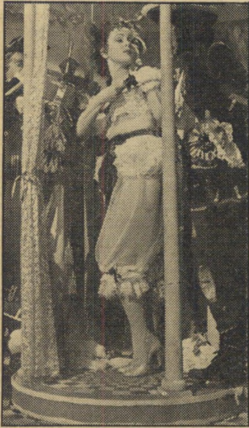
נדיה גריי ב, נפולוי צוהלת אתה תן לי משהו ואני אתן לך משהו.

כאן נגמך הסיפור בסרט ארבע בנות . בארני דשם (שחקן מנוח גארפילד) נפח את נשמתו בבית החולים. מאז ועד היום חלה התקדמות במדע הרפואה: חצי-פגר סינטרה