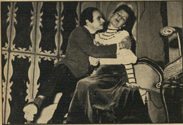
שחקנים וילנסקה ואלמו ב"הפאריסאית" מאת גברת פרנסקיה לאון

רות חייה והגורמים שהביאו למעמדה. המא דאם לא סירבה.