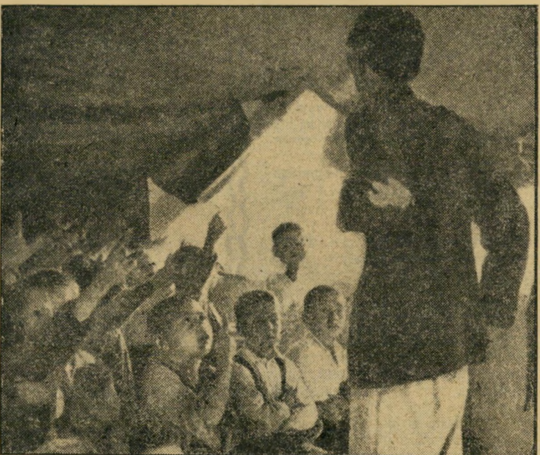
ילדים פלסטינאיים לומדים באוהל במחנה פליטים ליד יריחו. כיום יושבים בממלכת הירדן 600 אלף פליטים, מטילים את האשם במצבם על המלך עבדאללה, שעטו מן הצד, בזמן הכיבוש הישראלי.