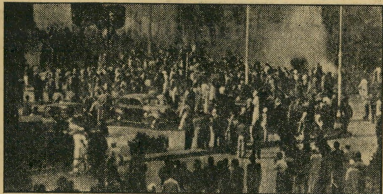
צילום במרכז עמאן, המראה קהל מפגינים עוצר מכונית. הפגנות השבוע שעבר קיבלו את דחיפתן ביוזמת המצרים שלא יראו בעין יפה את הצטרפות ירדן לברית בגדד הפרו-בריתית.