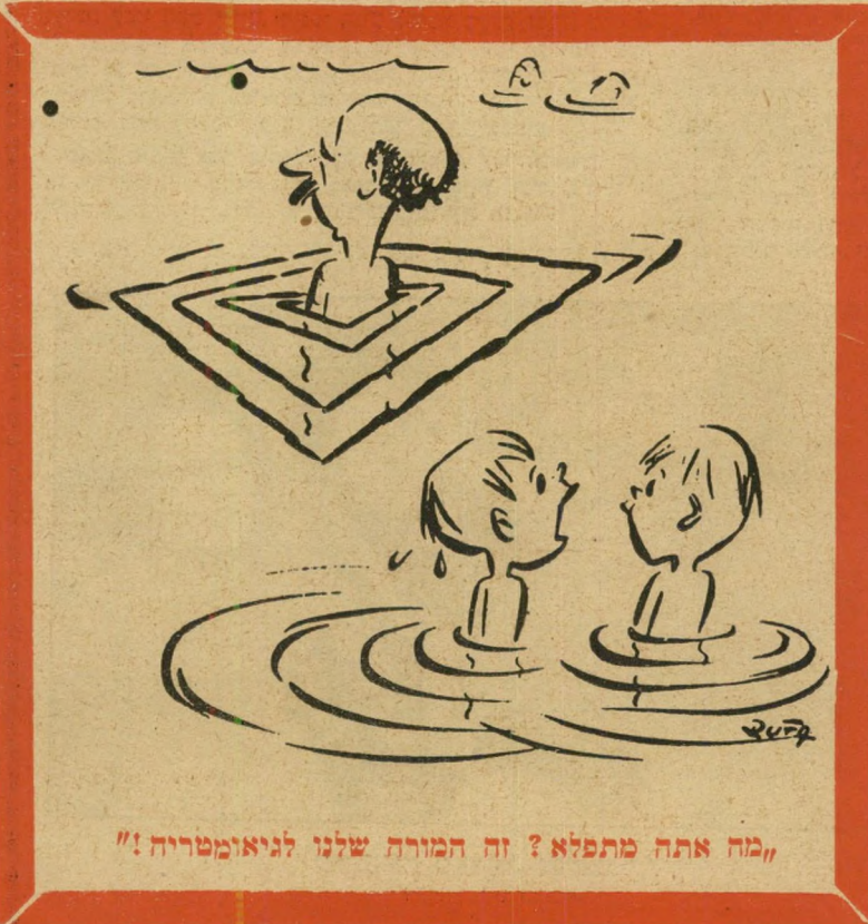
"מה אתה מתפלא? זה המורת שלנו לניאומטריה!"

שוכרט התפרסם בכך, שאף פעם לא גמר את מה שהתחיל.