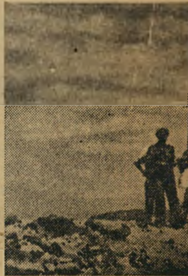
סח שקיחול בראש הגבעה.