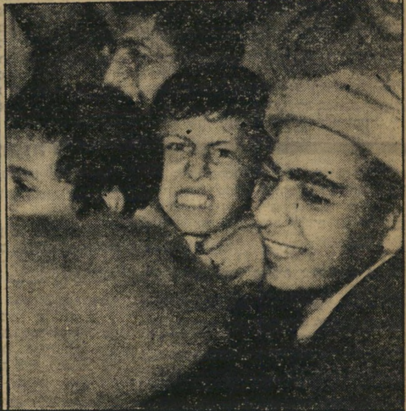
8000 רגליים רוקדות: מחוסר מקום, רקדו החסידים בנושים שלמים, במקום במעמלים. הגוש כולו מסתדר ככוכב, מסתובב מסביב לצירו. רוב השירים הם שירי-עם רוסיים, ביניהם שירי שתייה חבדיים שרים את השירים במקור רוסי או בהעתקה אידישית.