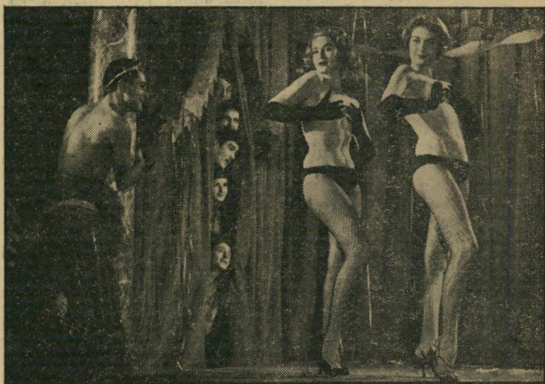
"הרופאים" הצעירים של פאריס אינם מבלים רק בנשפי מסכות בהן המסכות העיקריות הן עלי תאנה. הם גם מחפשים את זרעם בחיים, ברפואה, וכמובן, באהבה.

הקולנוע המאופייני עלידי תכלת — מנבר שות הקיר עד למסך בד הכסף הסינמסקופי — נוהג לפי צבעו, מחלק לבאיו רק טוב. די היינו: סרטים טובים.