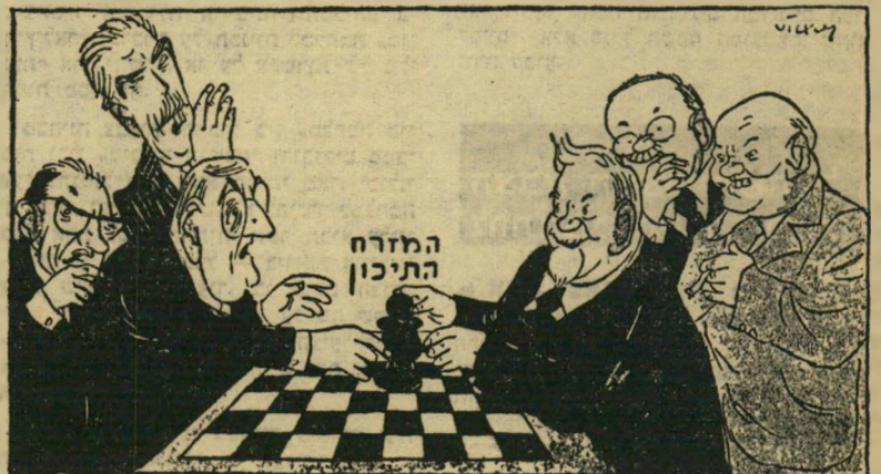
אבל זה הכלי שלנו ו' אובסרבר, לונדון, בריטניה