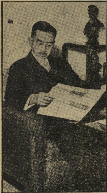
קורא הירוהיטו מה מותר לבן-האלים?

אולם קוויי סאטו לא קיבל טענה זו. ה" הלוואה המקורית היתה בסך 11.25 ריו,