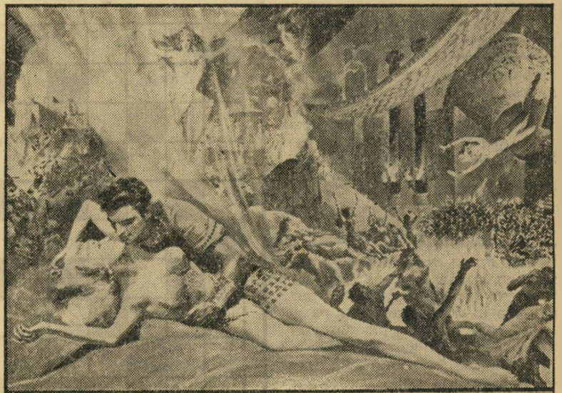
מראות כנען בהבן החוטא עם מאפו ובגדים שקופים, נגד הצנזור!

טון סטרג'ס, האחים מארקס, גריגורי לה-קאבה, אפילו ג'ון פורד. עכשו שולט בהר-ליבוד המזרח, הסרט התנ"כי (ראה למעלה) הליבנטיני. סטרג'ס מסריט בצרפת, להקאבה נפטרו, פורד עסוק בסרטי מערב-פרוע, הא-חים מארקס נפרדו, מופיעים בעיקר בטל-ביזיה.