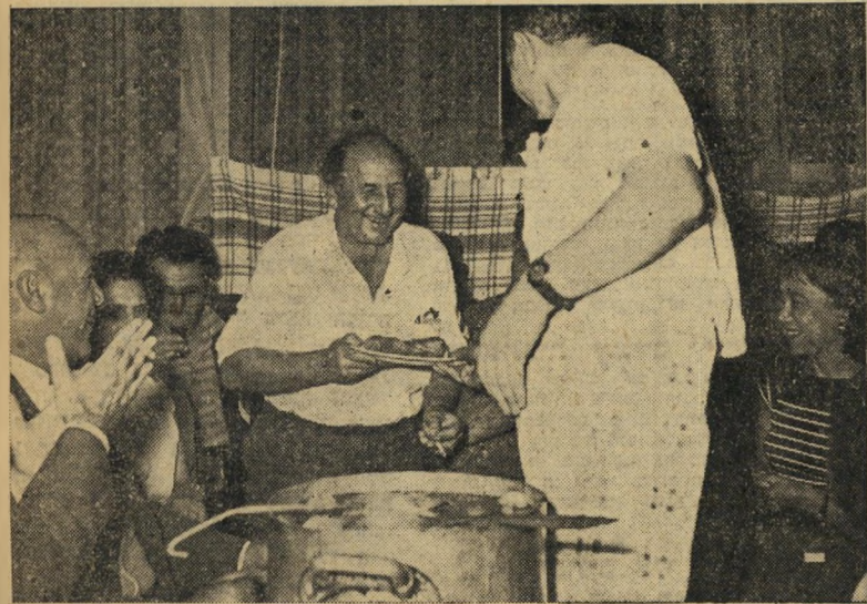
סיר הפירים . מסמר המסיבה היה סיר החמין הגדול, המלא מעייט ממולאים מהבילים, שחולקו למטובים. יושב-הראש שלונסקי הגדיר אותו: "סיר הפירים אשר לחצקל".

בקיבוץ גשר כשהוא שוטף את ריצפת חדרו, צעק מושח (חלך בשך ודם) שמיר לעברו: "יוסקוביץ, פעם אחת בחייך שטפת רצפה — וכבר תספו אותך..." כשגבר אחר-כך הרעש באולם, כטרם פתח בדבריו מוכיר מסא"י יונה כסה , חבר קבוצת שילר, אמר שלונסקי: "אני רואה שיש כאן כמה אנשים שהם מיקו כבר לשתות יותר מעשור כוסיות. ובי כן, בין עשור לכסה — אל תפרעו!"