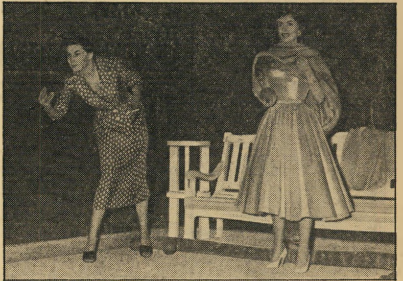
דודו וסילוואנה במשחק כדורת 1990 בבוהו, 1990 בבער.

ראש הממשלה דוד בן גוריון חיתר הש' בוע על הכנסה של 150 אלף דולאר, אותה הציע לו שבועון אמריקאי מפורסם תמורת פירסום זכרונותיו האישיים בסידרת-מאמרים.