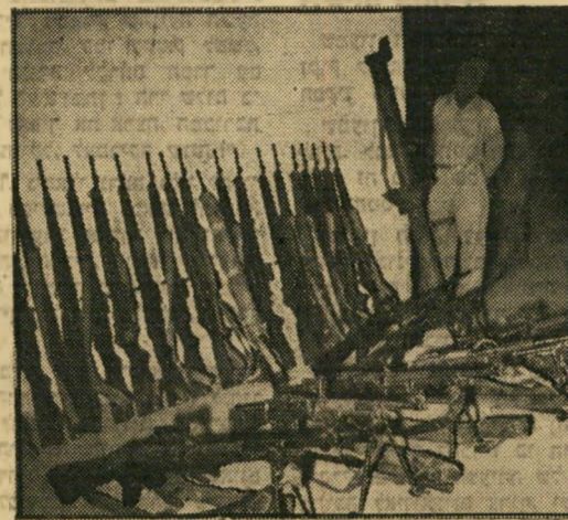
מקלעים ורובים אוטומטיים, מתוצרת בלגית, שנעזבו אף הם על ידי המצרים המובסים. לכל חייל היה נשק אישי אוטומטי.