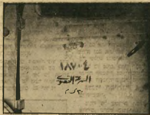
הוראות ערביות, מצוירות על דלת מכונת פארגו. למטה: אחד משני החיילים ש"נתרמו" על ידי המצרים לקרן המגן.