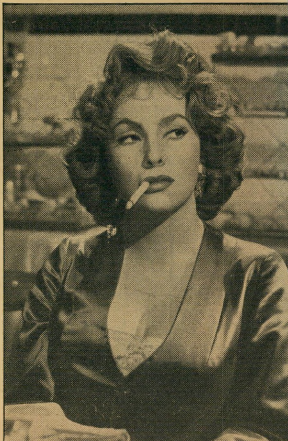
ג'ינה לולובריג'ידיה לחם...

אחרי עבודתם המשותפת נוהגים השניים לטעוד יחד, ללא