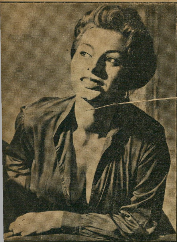
סופיה לורן ... ומה עתה?

מלוחים. אחר-כך נפרדים — היא לביתה, הוא לבית-המלון שלו.