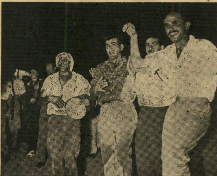
„חבורת האשׁ- יצאה בריקודים ברחוב דיוזנגוף בתל-אביב, הציבה לידה שורת שולחנות להתרמת העוברים ושבים.“