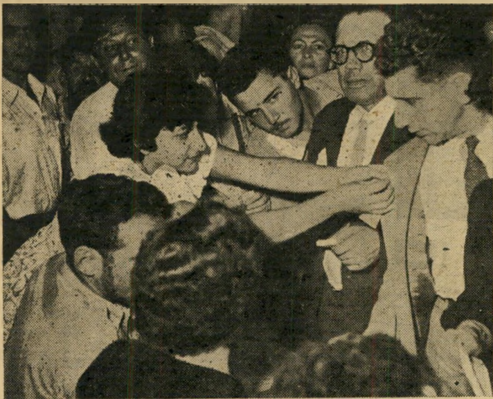
1250 ל"י נאספו במקום תוך שדוש שעות, נוסף על שטון ועגילי זהב שהובאו על-ידי ילדה בת תשע, מבעות נשואין שנתרמו בהם.

קרב באי בית-הכנסת הקטן ברחוב סירקין החיפאי. בהיותו כהן היה עולה מדי פעם למדרגות ארון-הקודש, סוגה לקהל ומברכו בברכת-כהנים.