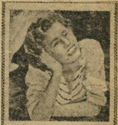
הצאר החוטא רומן מרי היסיה בזר הצאר