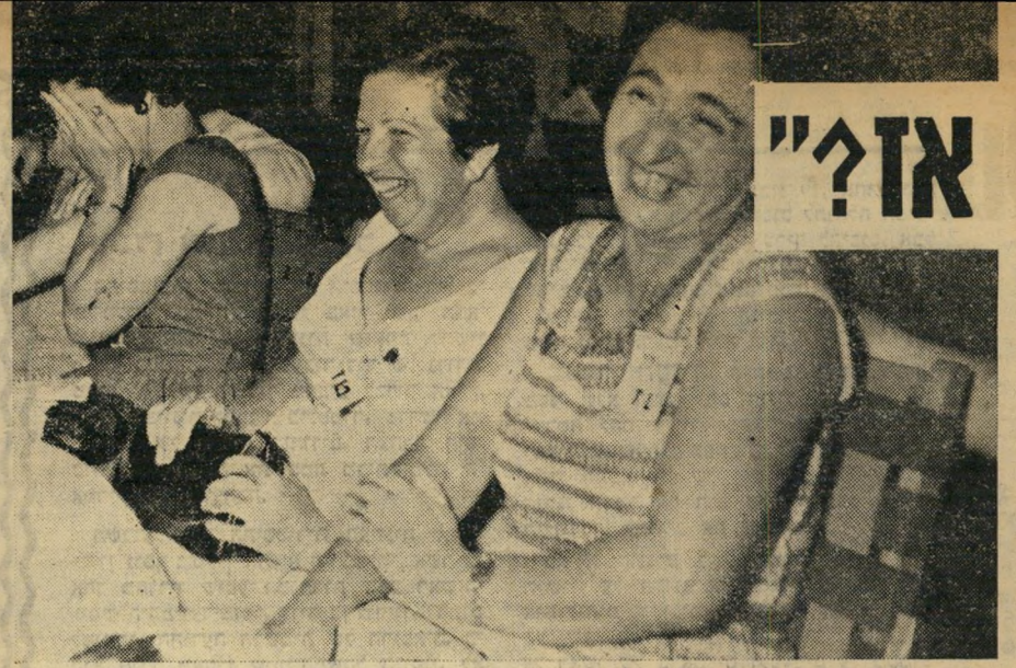
"להיים ו" מסיבה בבית קפה. כשהגיע הזמן להזמין את המשקאות נשאלה השאלה של אז "נו, בנות, מה תשתו?" התשובות היו מודרניות: "נסקפה!" "בשבילי, וויסקי אנד סודה"