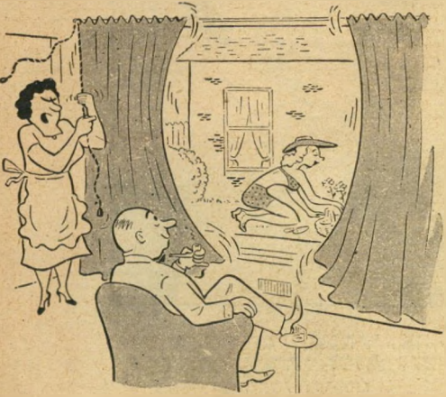
ועכשיו — הפסקה של 10 דקות לארוחת-צהריים!

יתכן, כי נכונותם של צעירים להינשא תגי' בר בהרבה, אם ייקבע שבית-דין אורחי מיו' חד, בהשתתפות מומחים סוציאליים מנוסים. יהיה מוסמך לאשר גירושין בכל מקרה שבו יגיע למסקנה ששוב אין סיכוי לתיקון חיי הנישואין.