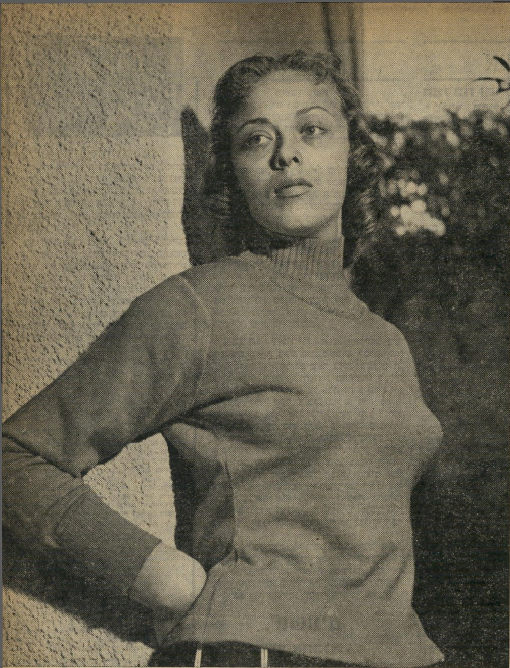
האפודה על זינה. אם כי האפודות אינן צמודות לגוף, אלא מונחות, השנה, עליו ברישול'מה, התאימה כל אפודה בדיוק לזינה, בין שהיתה זאת אפודה קלאסית שחורה (למעלה) ובין שהיתה זאת אפודה לא'קלסית בצבע האלמוג עם מחשוף עמוק וצווארון לבן, למשל. כל אלה התאימו לה ועוררו את התפעלותו של הקהל.