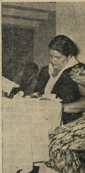
האופנה הראשון בפרנקפורט הגר-איות את תפקיון בכל תצוגה: מה האחרות צריכות ללבוש.

תיים עברו הכובעים שעוד אפשר הו לתאר על ראשה של צברית. ו דוקא להן התכוונה המציגה כפי שאפשר היה לצפות, בגר-יצה את שמות הדגמים כאילו בת אוקינזוה, המופיעה בבית התה אוגוסט, אפילו אם היו להם שמות נגיים כחברי (משהו הדומה לכובע אל-על (ברט קטיפה בצבע בורדו,