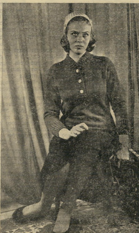
אפודה כתולה זאת איבדה את צווארונה הלבן, הניתן להסרה בשעת הרצון ולשימוש נוסף, כי אחרי הסרתו הפך צווארון הזה לכובע צמר אוסף שערות (למעלה).