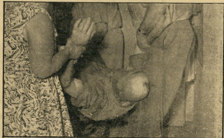
"רופא! רופא!" בלהט הקרב נפל הזקן מתעלף, מועבר למיטה עליידי בנו ושכנה.

(25), נשואה לרופא ואם לילה, עובדת בתפ-קיד אחראי בבית-החולים הממשלתי למחלות כרוניות בצריפין. לרוץ מזלה סבלה ממחלה כרונית של חוסר-דיוור, והיא גרה עד כה אצל אחיה.