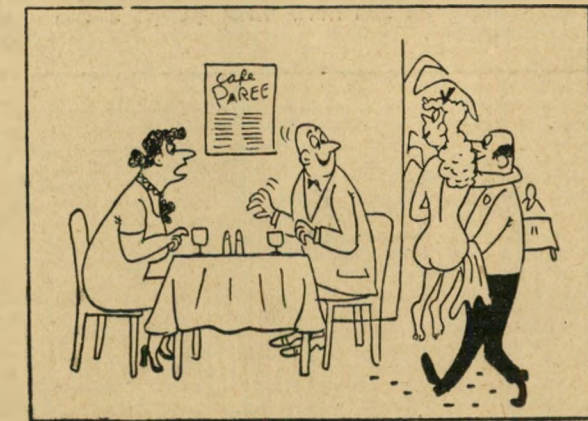
"אמרתי לך לא להזמין בצרפתית!"

מנגן סאכסופון , שנאסר בלונדון לאחר שניגן ברח"בות וקיבץ נדבות, טען בפני שו"פט כי הוא נוהג לנגן בחוץ רק מפני שהאקוסטיקה משובחת הר"בה יותר מאשר באולמי הקונ"צרטים.