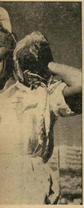
עדלאידע כלי פורים. אולנה סרבליס לבנים, באו עם גינביב השלט „סכנה! אין מעצורי-אוויר