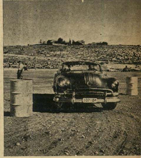
כסאות מוסיקאליים. בהיפסק המוסיקה עצרו המכוניות כשהבחורות מזנקות מתוכן לתפוס כסא במרכז של המגרש.