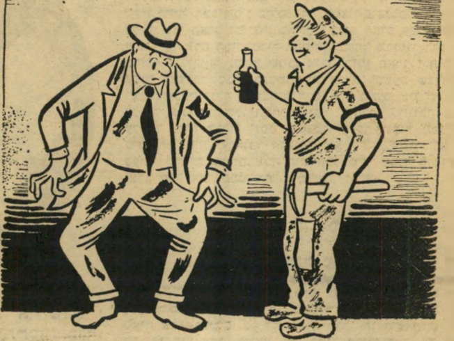
אתה דואג לבגדים!! תכנס אל א.ב.ג. ותזמין לך חליפה חדשה