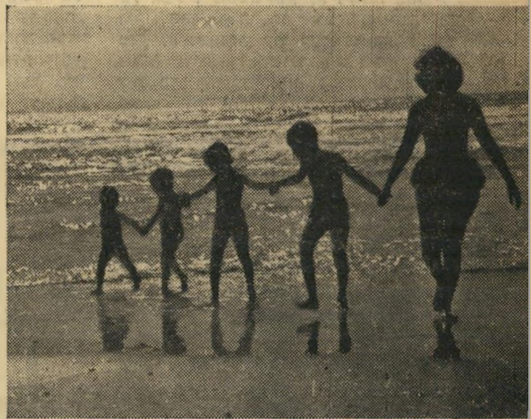
16:20 — אחר-הצהריים בשפת-הים. לפנות ערב מתאחדת לפעמים המשפחה, ונוסעת לשפת-הים בהרצליה או בבת-ים.

לשגיאה זו. עוד לפני נ בעצמה, זואגת לש" ועשויה בטעם, כדי ים ורענן לקראת יום העבודה בטמפר אמ"