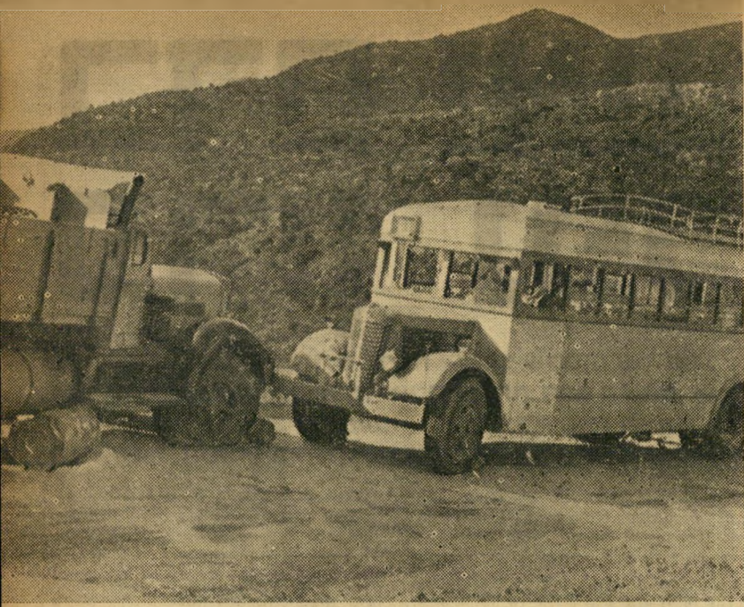
נשיקת טמכונים: אוטובוס הדמים כ/796 מנשק, בהכרת תודה סמלית, את מכונית המשא שבאה מנגד, הצילה את 13 יושבי האוטובוס ממוות. המתנקשים ברחו בראותם את המשאית.