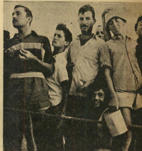
אספר לנכדים שלי... התפאר אחד הנערים שבאו לבקר במקום הקידוח. הא היה אחד ממאות הנערים שבאו מכל הארץ לקחת מעט נפט למזכרת.