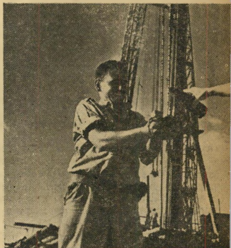
הכוסם הריחני ביותר אינו יכול להתחרות עם הנפט של חולייקאת. מברק זה רווחץ בו את ידיו.