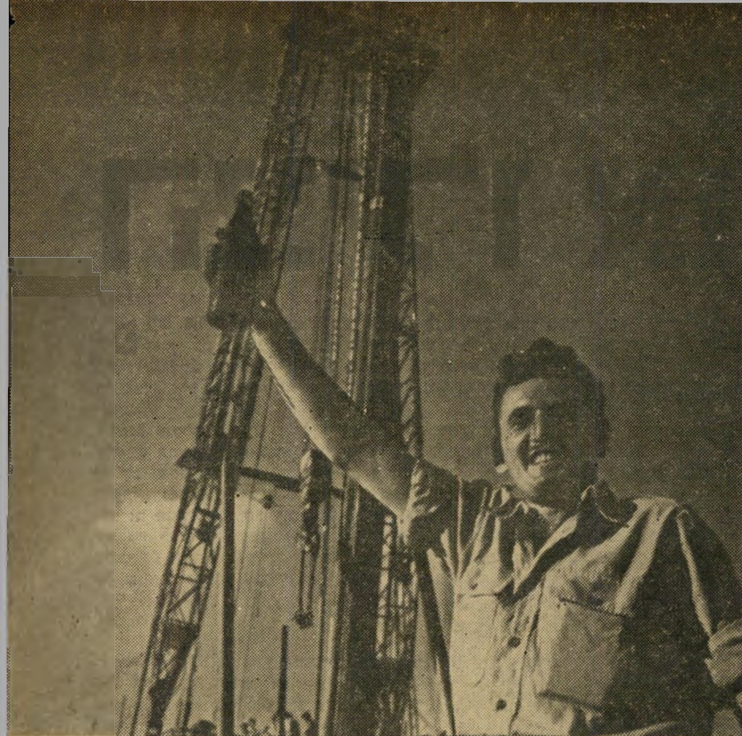
לחיים! קורא צעיר זה בשמחה, כשהוא מרים בקבוק יין שמולא נפט גלמי. ברקט מדקר מגדל הקידוח לגובה של 45 מטר, המיבנה הגבוה ביותר בארץ. בראש המגדל מתנוסס דגל ישראל. הוא הונף עם התחלת הקידוח במקום, 24 ימים לפני שנתגלה הנפט.