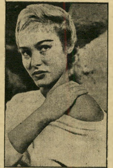
כוכבת אנדרס צרוץ של בראנדו ?