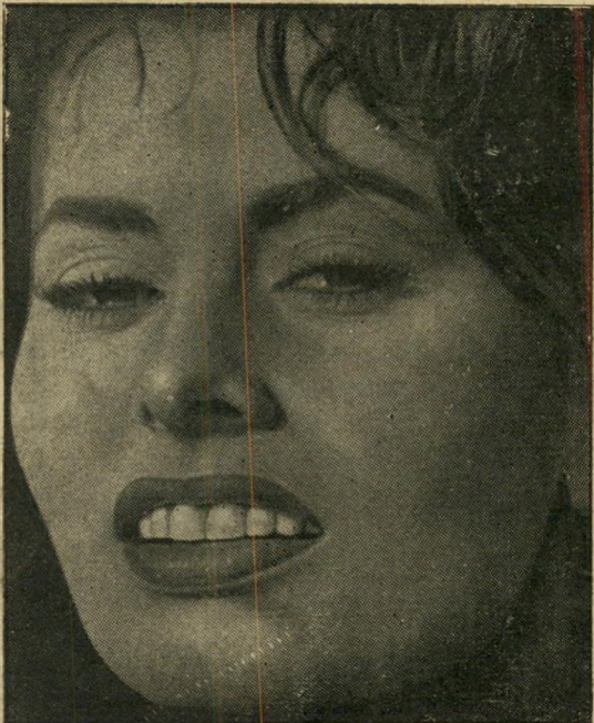
כוכבת לורן צעירה, לא מאופרת

הכוכבת גודי הולירי, בתשובה לעיתונאי שביקש לשמוע מפייה את קורות חייה: "אשה מאושרת, ממש כמו מדינה מאושרת, היא זאת שאין לה היסטוריה."