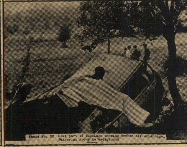
Photo No. 20 Rear part of fuselage showing broken off escape hatch. Nigerian group in background.

שוטרים בולגריים עם שנים מחברי המשלחת הישראלית. חלקי הזנב שנחתכו ביד, לאחר הפלת המטוס.