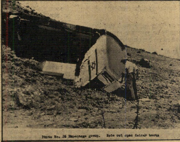
Photo No. 24 Damage group. Note cut open door locks.