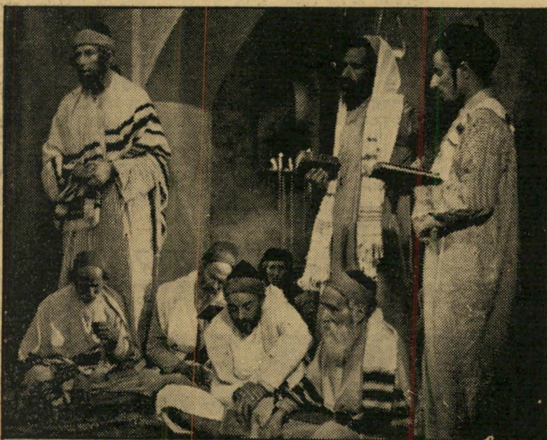
מתפללי "באין מולדת" על טל ומטר של כסף

זו היתה החלטתם של מתפללי בית הכנסת בארץ מורחית בלתי מוגדרת בסרט ב' אין מולדת. החלטתם של האנשים החיים תושבי נוה-עמל, שנשכרו במחיר 8 ל"י ליום על מנת לגלם את דמויות העלילה בבית התפילה שהותקן באולפן ההסרטה בהרצליה.