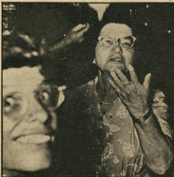
שונאת-צידום פודה מדוע לשבור?