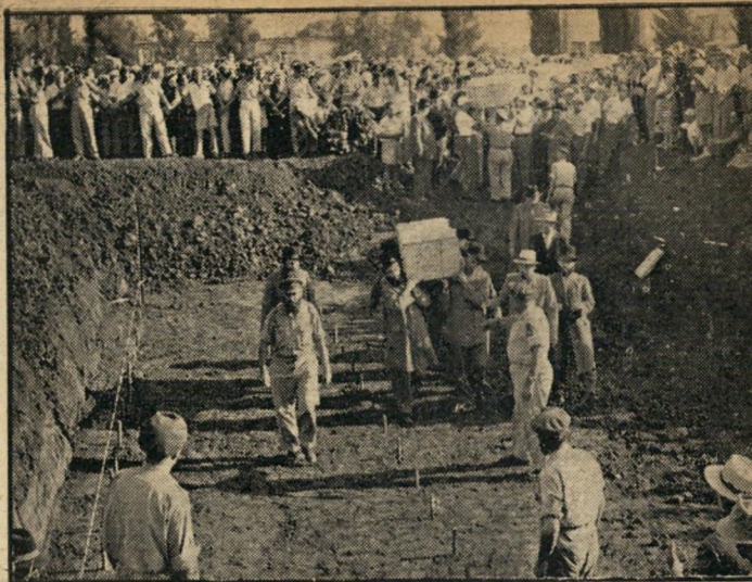
קץ נתיב היסורים בבית הקברות של קרית שאול. שישה אנשים נושאים את הארון הראשון אל תוך קבר הענק. 58 הארונות הונחו בשלוש שורות ארוכות, לפי המספרים היסודיים שנרשמו עליהם.