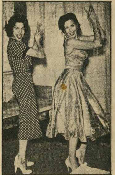
רקדניות מינה וגמאד בקהיר: בטן מול בטן

ישנם כאן סטודנטים מכל ארצות ערב, רובם ככולם מהשכבות העליונות. גדול במיוחד מספרם של אלה מבין הפליטים שמרצאם מירושלים, ומאללה וחברון. יחסינו