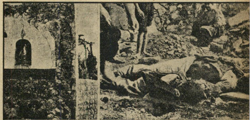
לאם ופלגיה -- מתישקה מן תעת אלנפלס -- وكانت اليم نعلو وانما ال سدرها لقيه الموت الاجرام اليهودي منها من ان تعقر امتها فلعينها وطلها يشكون الى انه على العدوان اليهودي هذا منزل مدير المدرسة الذي لسا مدرسته التي يعلو فيها طلاب ...

כן : ח/56, צ/2, ש/2. לא : א/10, ב/5, גד/5, מ/10, פ/10, ק/10, תו/10.