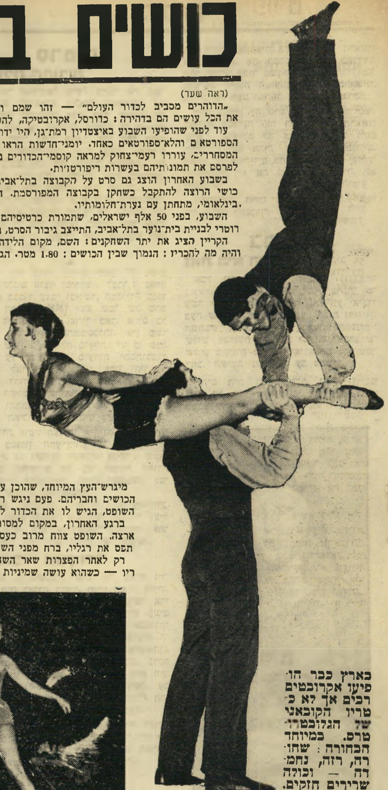
בארץ כבר היו פיענו אקרובטים רבים אך לא כ-טריו הקובאני שד הגלובטרטרס. כמיוחד הכחורה: שתו-רה, רזה, נחמ-דה — וכולה שרירים חזקים.