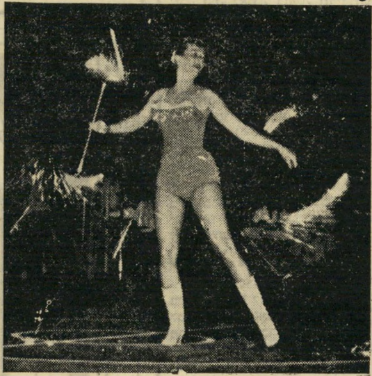
כסרטים אמריקאים, רואים תמיד נערת שרביט בראש תהלוכה. שרי מקקים (ראה שער) צועדת במקל שקצותיו זיקוקים.