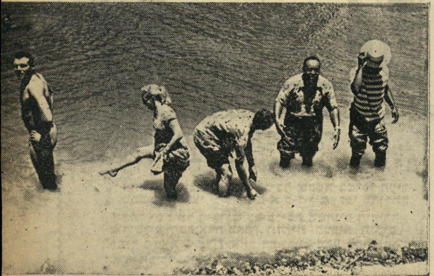
המים הקדושים של הירדן משכו את אנשי הלהקה ביום הראשון לבואם ארצה. הם נטעו למען הירדן ובעוד שמארחיהם הציעו להם בקבוקים של מים קדושים, העדיפו