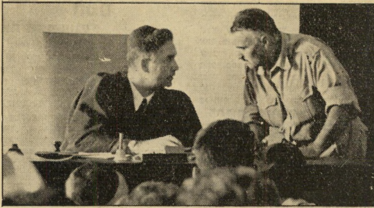
שמש שלמה ושופט הדני התוכן נשאר סודי

וגדל לקומת ענק, השתלט על הדייג. ואז נוכח הדייג לדעת שקל יותר להוציא ג'ון מן הבקבוק מאשר להחזירו לשם. השבוע התפוצצה בחיפה, ובכותרות הראשיות של עיתוני הערב, פצצת-רעש גדולה. מנהיגי מפא"י, שא נבחרו כשהוציא מי שהוציא את שד הטרור מן הבקבוק ושלוו נגד העולם הזה. נדמה לדעת כי מסוכן מאד לחלוץ את הפקק. כי הרוח הרעה ש הטרור שהעולם הזה הזהיר פעמים אין-ספור שעדיין לא גועה בישראל, היא רוח מסוכנת, מדבקת, ואיש אינו יכול לדעת מראש מה תעולל מחר.