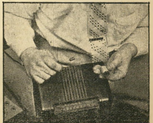
מספיק להכניס מכשיר פנימי זה לתוך כל מקלט רדיו כדי להפכו למכשיר האזנה יעיל ובטוח.

בשעת, נקראתי למדינת אלאבמה לחסור מקום שבו היה מערב מנהל חברה למוצרי מתכת. אשת המנהל חשדה בו בבגידה, אולם לא היה בידיה כדי להוכיח זאת. צעדי הראשון