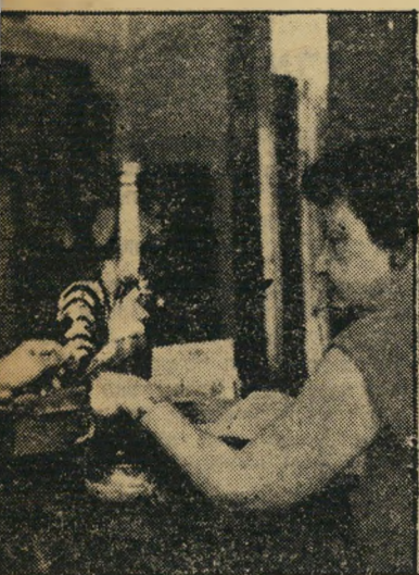
זקמצינית מוכנה לתת הלוואה של 5 ל"י עבור התרנגול, 45 ל"י עבור המצלמה.

נוכחתי כי המקצוע היהודי העתיק של הלוואה תמורת משכונות, שבימי הביניים פירסם לגנאי את יהודי אירופה ואף נזכר במחזהו של שקספיר הסוחר מוונציה, לא גוע בישראל. אורבה, מצוקת האשראי הפורצת בעיקר באנשים קטנים, פקידים שמשכורתי תם מתאחרת הצריכים לחכות זמן רב לכומים המגיעים להם ממוסדות ציבוריים וממשלתיים, שיגשג ופרח. בעלי בתרי העכוט אימדים את ציבור לקוחותיהם הכ"ל במספר של 15 אלף איש, בתוכם שחקני תיאטרון ידועים ופקידים בעלי שם בע"כ בור. כל אלה נאלצים שלוש או ארבע פעמים בשנה לארוז את אחד מחפצי-ביתם היקרים, להביאם אל הלון העכוט ולקבל עבורם את הסכום הזעיר שיקיים אותם לחודש חודשיים — עד יעביר זעם.