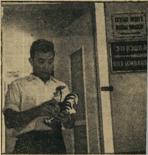
זר-נון גראמא. אל תביא לנו פורצלן במקום זהבוי. על משכון. "אילו זה היה תרנגול חי, ייתכן והייתי מקבלו"