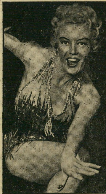
פצצה חדשה נורת גם ללבוש, גם למעורמים

לפני חדשים מספר התקיים בקול ישראל שולחן עגול על בעיות הצנזורה. בתום ה- שידור פנה מי שהיה אז יושב-ראש המועצה לבקורת סרטים ומחנות שליד משרד-הפנים, ישראל ישעיה, אל אחד המשתתפים שהתקיף קשות את הצנזורה, הבטיח לו שב"ב-קרב יחול מפנה בעבודת הצנזורה. "עונו תגעגעו