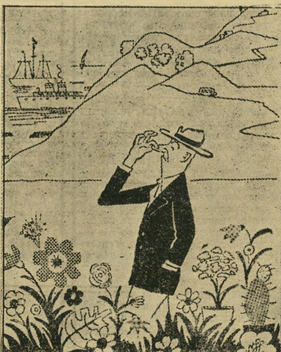
שבוע הפרח בחיפה