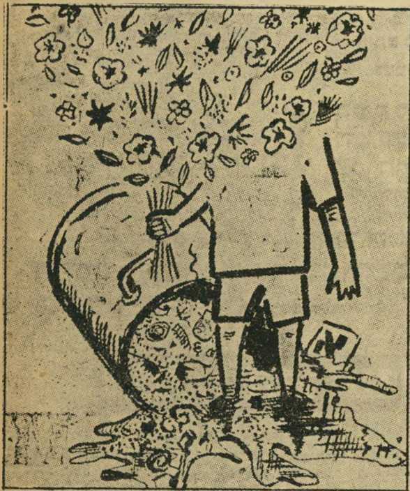
פרצופו של אבא חושי מופתר, אמנם