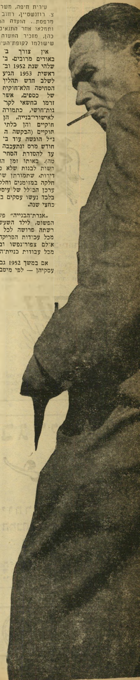
אבא חושי: אני נכון להיות מנקה רחובות (זאב, זמנים)