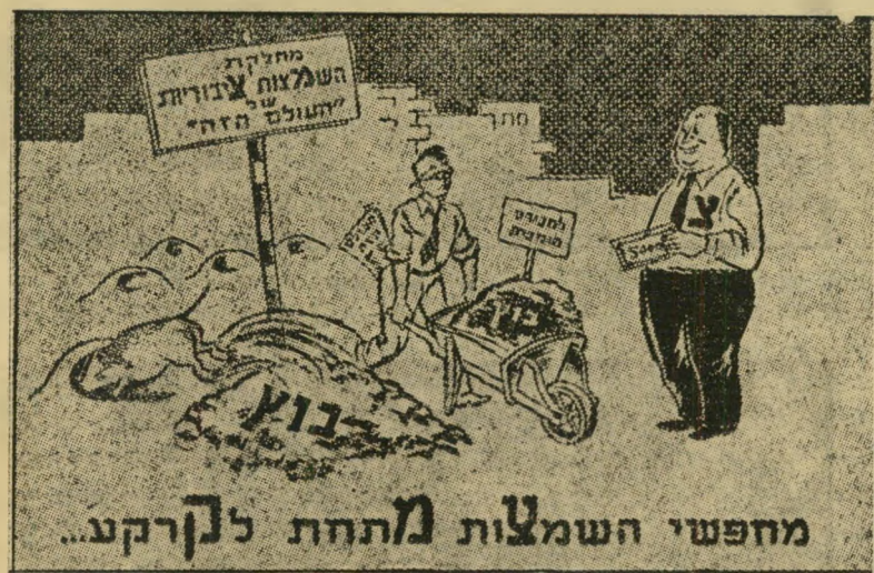
(אלמוני, חוברת אלמונית, דפוס אלמוני)

כה אמר, אודות קרנות שעסקיהן מוערכים ברבע מיליון, האדם אשר למשרדו נמסרו,