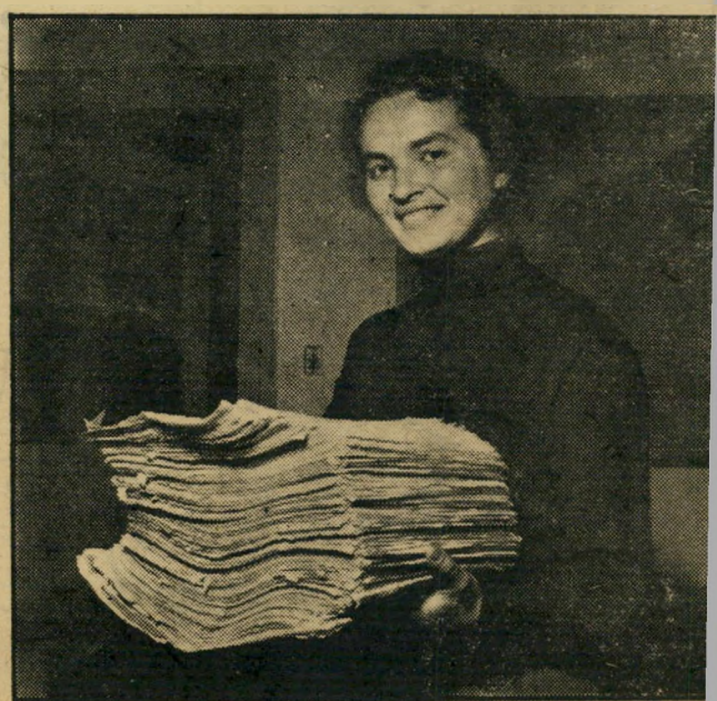
התשובות: מכונת מיון, המחיינת, מונה, מלוחות ומדפיסה סיכומים במהירות של 400 כרטיסים לדקה, טיכמה תשובות קוראי העולם הזה.